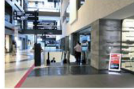
view B 右手タワーBオフィスエントランスを越えてすぐの下りエスカレーターに乗り1Fに降ります。