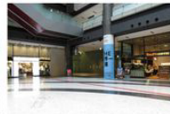
view B 正面[AIX]右手[TULLY'S COFFEE]のあいだ奥に、タワーCオフィスエントランスがあります。タワーCオフィスエントランスにお進みください。