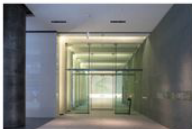
view C タワーCオフィスエントランスホールの突き当たり右手に進むと、エレベーターホール入口があります。