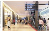
view A 北館に入ると正面に誘導サインが掲示されています。[カンファレンスルーム タワーC]の誘導に従って北館中央のナレッジプラザにお進みください。