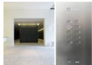
view D 8階上がります。(A-Bどちらのエレベーターでも使えます。)