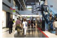
view A 北館に入ると正面に誘導サインが掲示されています。[カンファレンスルーム タワーC]を目前してお進みください。