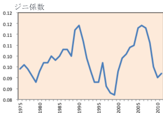
図1 都道府県ジニの推移

では、多くの政策論議の枕詞となっている「経済格差」は存在しないのだろうか。よく使われる格差の指標としては、たとえば、関西圏と東京圏の地域GDPの相対比率や、経済的に最も豊かな県と最も貧しい県とで一人当たりGDPに何倍の開きがあるか、などがあるが、格差論のためには地域の一人当たり県民所得について分布の全体像を知る必要がある。 2