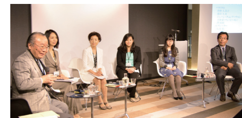
● APIR・APU連携協定調印イベント(下記参照)