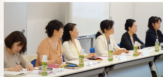
APIRでは、女性が構成メンバーを占める研究会を実施(関西の女性就業率向上に向けた提言「女性は関西で夢を描けるか? 鉄は熱いうちに打て」研究会)

APIRには、これまで以上に企業とのコミュニケーションを密にして、「より役に立つ」研究所として、こうした活動を能動的に展開していただくようお願いいたします。