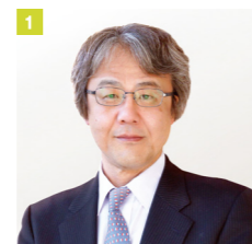
1 リサーチリーダー／上席研究員 岩本 武和氏 (京都大学 教授)