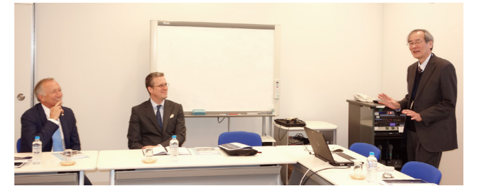
Paul J. Massicotte上院議員(左端)