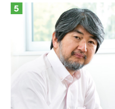
5 リサーチリーダー／上席研究員 下條 真司氏 (大阪大学 教授)