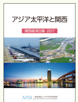
アジア太平洋と関西 関西経済白書2017